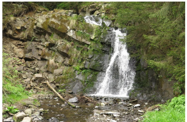
Der Wasserfall im Spiegeltal