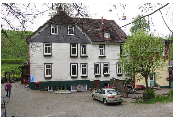
Hotel zur Untermühle

Für eine kurze Rast bei einem Stück Kuchen mit Kaffee oder Tee im Restaurant oder Hotelgarten ist jetzt der richtige Zeitpunkt gekommen.